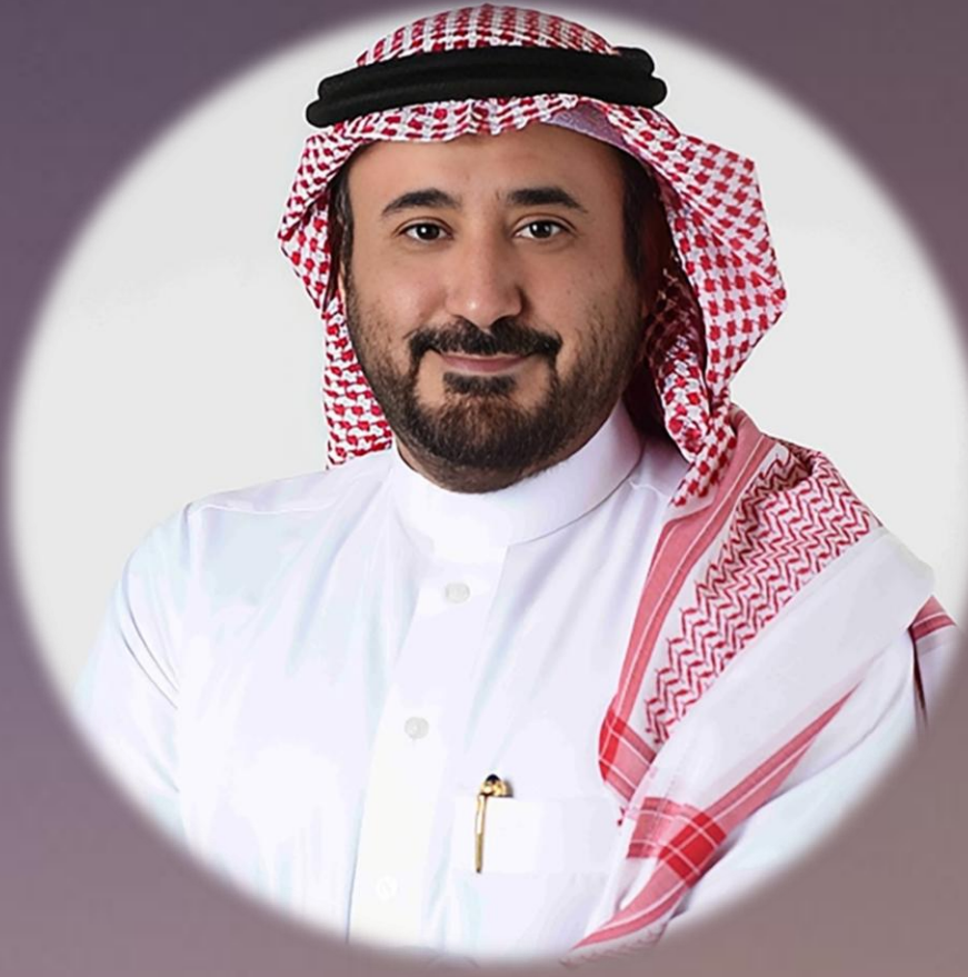
العضوية في مجالس الإدارة (في منشآت خاضعة لإشراف الهيئة)

كوننا شركة رائدة جيدة التأسيس، فريقنا من ذوي الخبرات و الكفاءات، وبمعرفة وعلم بالقوانين المحلية التي تعتبر مهمة للعملاء في تنفيذ الأعمال بجودة عالية.